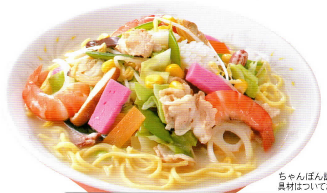
ちゃんぽん調理例 具材はついておりません