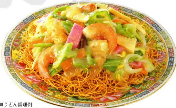
血うどん調理例 具材はついておりません