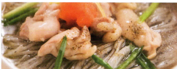
手延べ黒ごま麺 調理例