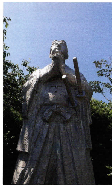
世界文化遺産 「長崎と天草地方の潜伏キリシタン関連遺産」 島原の乱最後の舞台「原城跡」

めん の 山 一 の手延べ麺は全て厚生労働省認定の単一等級製麺技能士を取得した麺匠が心を込めて作っております。