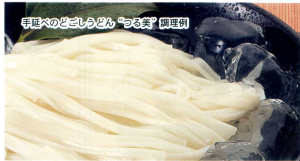
手延べのどごしうどん “つる美” 調理例

1973年に路面電車が目の前を走る長崎大学の正門前にオープンした「フラワーメイト」。地元の人、学生から愛され続ける人気の洋食店。長崎名物トルコライスなどが気軽に食べられます。