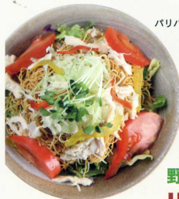
パリパリサラダ麺調理例

品番 YKR-30 焼きラーメン 80g×8束 8人前 特製あごダレスープ 8食 税込小売価格 3,240円 (税抜 3,000円)